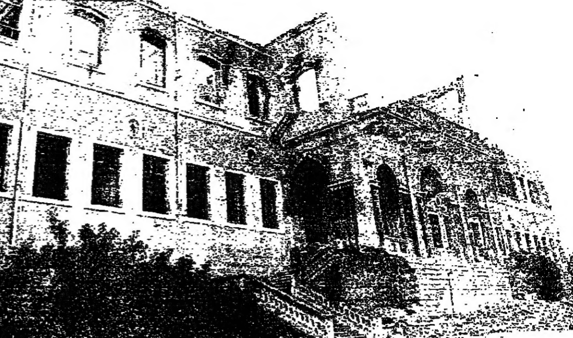
مخزل مكاتب الجريدة في السراي

من الإدارات الحكومية التي عطلتها الأحداث، الجريدة الرسمية... التي تنشر القوانين والمراسيم الحكومية قوة النفاذ، والصفحة الرسمية ذاتية، وبدونها لا يصبح قانون نافذاً ولا مرسوم صالحاً للتطبيق. على ان الحكومة، وبصورة استثنائية عرضتها للظروف، ابتكرت طريقة جديدة لنشر المراسيم التي تصدرها مؤخراً، وهي نشر هذه القوانين على باب رئاسة الحكومة، واعتبرت هذه المراسيم نافذة من تاريخ تطبيقها على باب رئاسة الحكومة، كما كانت تنشرها في السابق نافذة من تاريخ النشر في الجريدة الرسمية. لكن لتشر على باب رئاسة الحكومة قد يصلح بالنسبة الى المراسيم ذات الطابع الإداري، لكنها لا تصلح للمراسيم التشريعية التي تتضمن قوانين وعقوبات، كالمرسوم الذي صدر بصدد قرش الرقابة على الصحف. وتعليقاً، قال احد القضاة، انني كقاضى لم اتفخ هذا المرسوم بعد، وإذا صدق ان احيل امامي احد الصحفيين، هل ادعه في مكنتي واذهب الى السراي الجديدة، لآقرأ نص القانون الذي سحلكه على اساسه؟